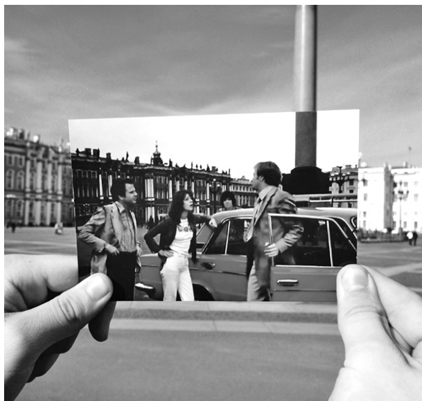
Ленинград вчера в фильме «Невероятные приключения итальянцев в России» и Санкт-Петербург сегодня

«Старик Хоттабыч» — сказка, знакомая всем с детства. Вспомним момент, когда персонажи фильма приходят на детскую площадку возле скульптуры «Прием в пионеры». Если присмотреться, мы увидим, что скульптура стоит спиной к Московскому